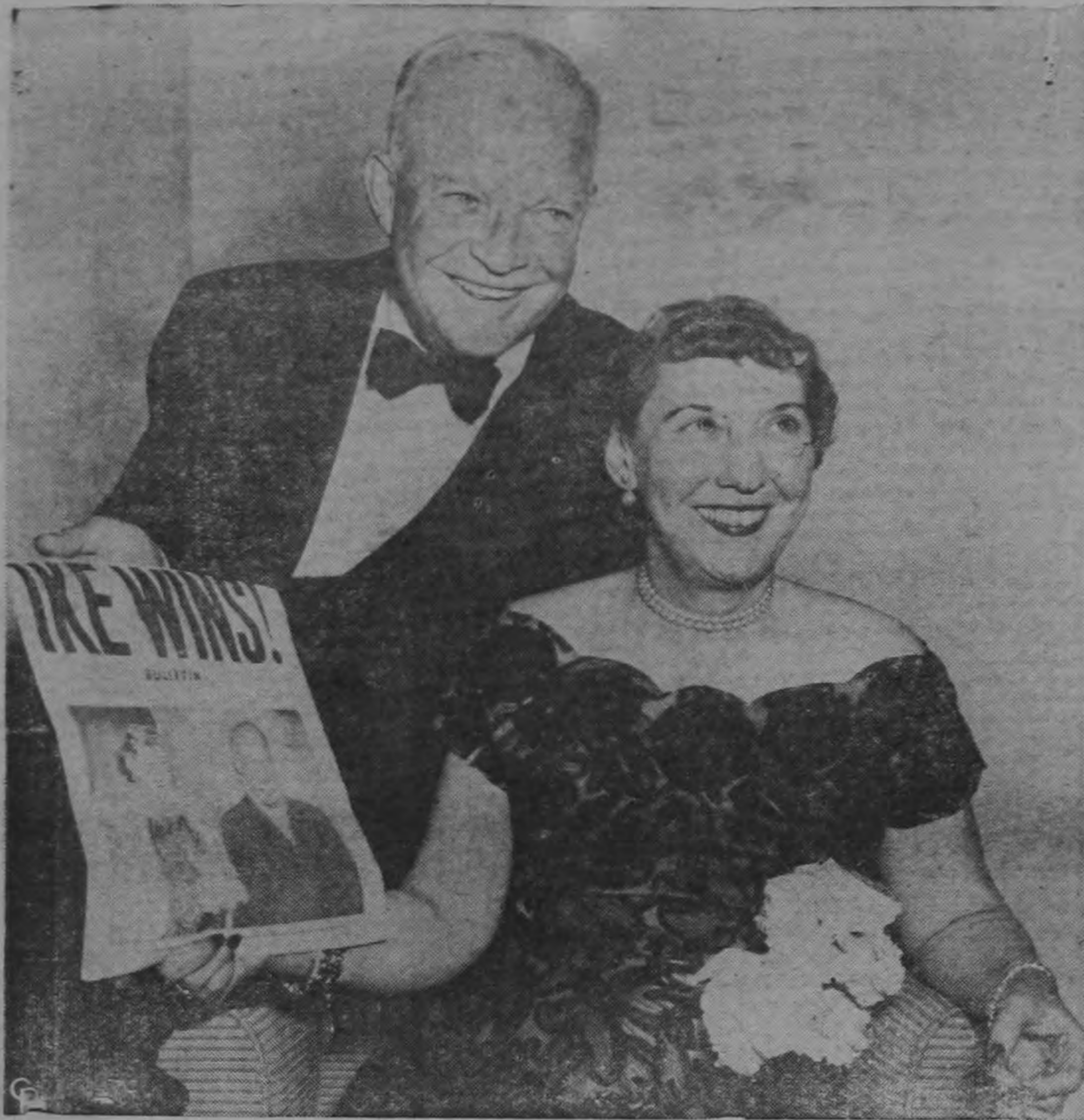
El Presidente-Electo de los Estados Unidos Dwight D. Eisenhower y su esposa Mamie, sujetan felices un periódico que anuncia la victoria del general, en el Cuartel General Republicano en el Hotel Commodore de Nueva York.