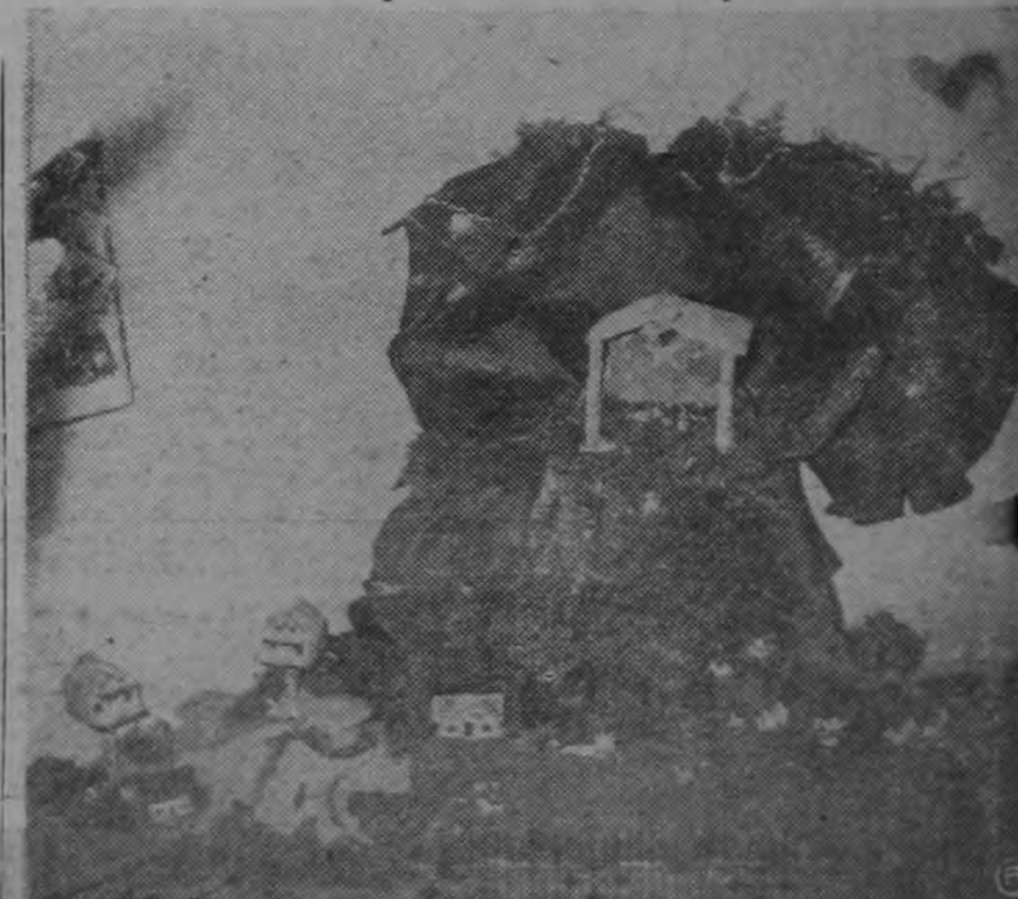
En la exposición de trabajos infantiles de los Kinder, se presenta, entre muchos otros, este Portal instalado sobre un cerro, cuyas faldas se diseminan las casitas y el ganado.