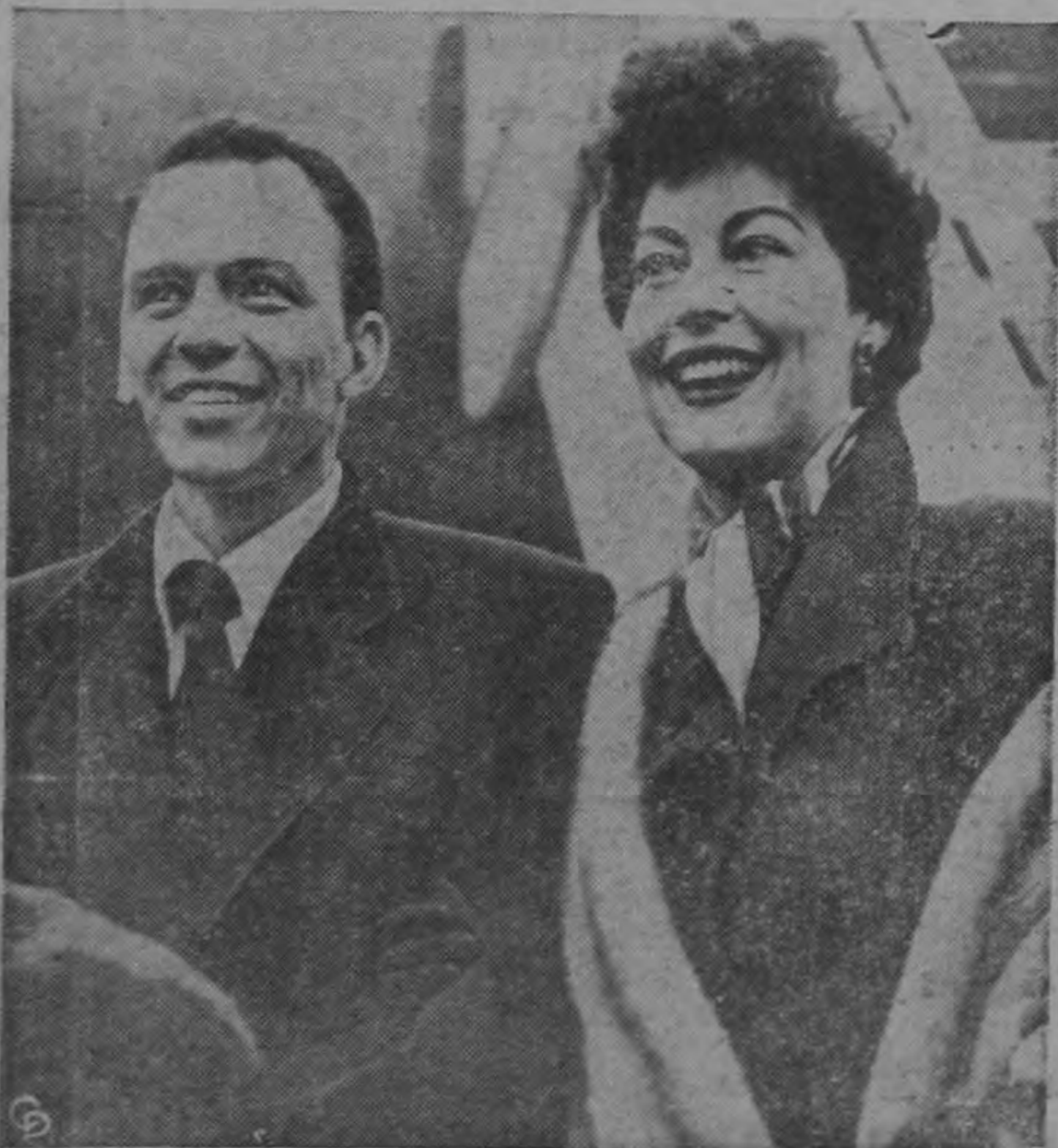
El cantante Fran Sinatra y su esposa, la artista del cine Ava Gardner, parecen una pareja en luna de miel a pesar de sus recientes reyertas conyugales, al llegar por avión a Londres. La artista dejará a su esposo para seguir al África donde hará una película con Clark Gable.